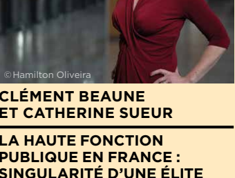
CLÉMENT BEAUNE ET CATHERINE SUEUR

LA HAUTE FONCTION PUBLIQUE EN FRANCE : SINGULARITÉ D'UNE ÉLITE À LA FRANÇAISE ?