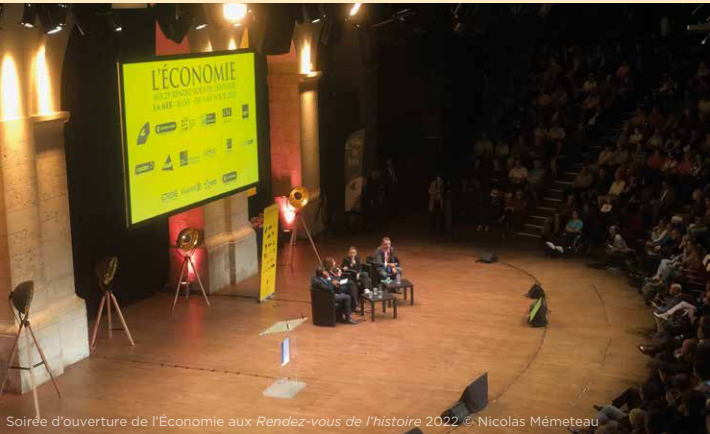
Soirée d'ouverture de l'Économie aux Rendez-vous de l'histoire 2022

L'ambition de l'Économie aux Rendez-vous de l'histoire est d'aborder la complexité des enjeux économiques contemporains grâce aux sciences humaines et au décryptage de l'actualité économique, sociale, environnementale et géopolitique. L'intervention de divers acteurs issus des milieux universitaire et académique, mais aussi du monde de l'entreprise, permet d'apporter un nouveau regard sur ces questions et des clés de compréhension du monde contemporain plus que jamais nécessaires.