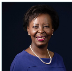
Louise MUSHIKIWABO Secrétaire générale de l'Organisation Internationale de la Francophonie

Présidente des 28 èmes Rendez-vous de l'histoire