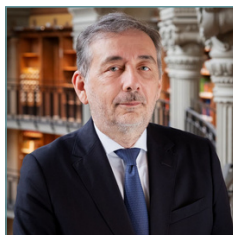
Gilles PÉCOUT Président de la Bibliothèque nationale de France