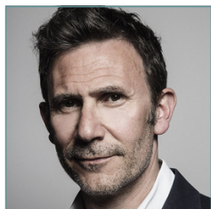
Michel HAZANAVICIUS Réalisateur, scénariste, producteur et acteur