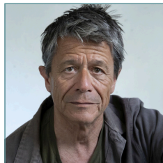
Emmanuel CARRÈRE Écrivain et scénariste