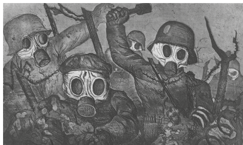
Otto Dix, Troupes montant à l'assaut sous les gaz (recueil Der Krieg , 1924)