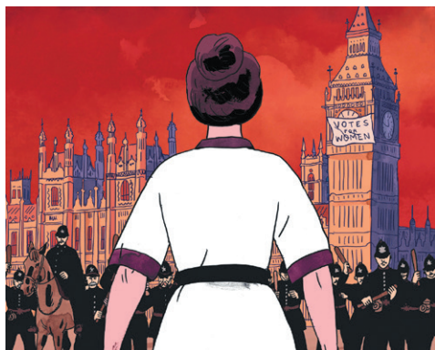
© Jujitsufragettes/Éditions Delcourt, 2020, Xavier, Lugrin, Ralenti