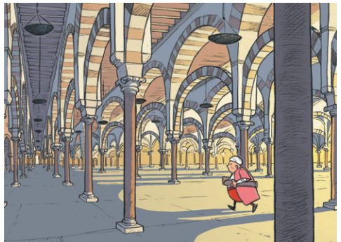
La Bibliomule de Cordoue de Chemineau et Lupano

Paul CHOPELIN , Pauline DUCRET et Emmanuel LEPAGE , Sylvain SAVOIA