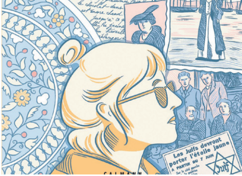
Tavitian Peron : À La Recherche de Jeanne