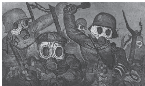
Otto Dix, Troupes montant à l'assaut sous les gaz (recueil Der Krieg , 1924)