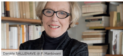
Danièle SALLENAVE