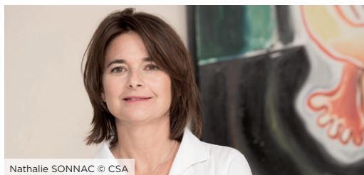
Nathalie SONNAC