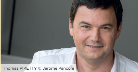
Thomas PIKETTY