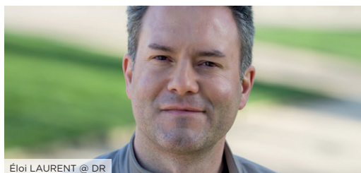
Éloi LAURENT @ DR