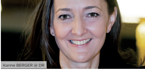
Karine BERGER