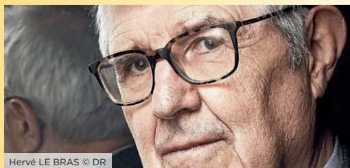
Hervé LE BRAS