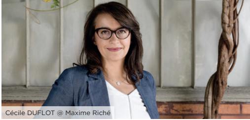
Cécile DUFLOT