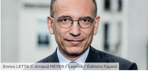
Enrico LETTA