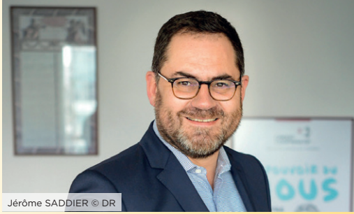
Jérôme SADDIER