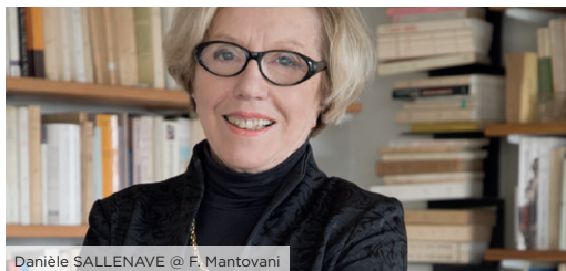
Danièle SALLENAVE