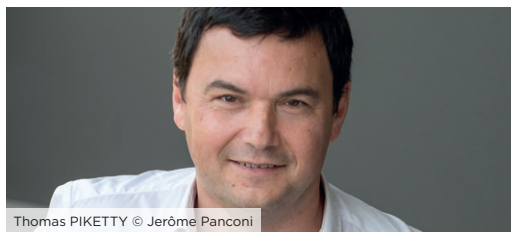
Thomas PIKETTY