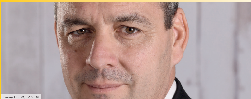
Laurent BERGER © DR