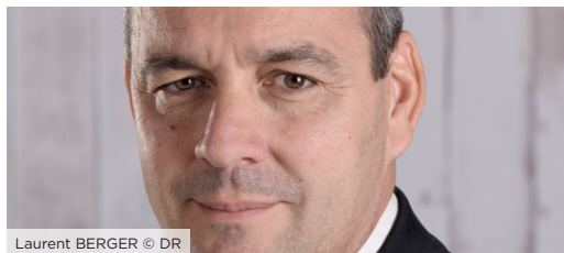
Laurent BERGER