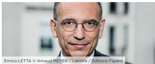
Enrico LETTA