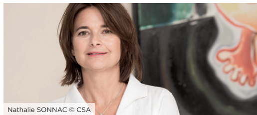
Nathalie SONNAC